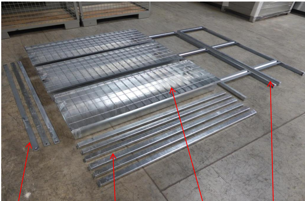
3 baguettes de maintien