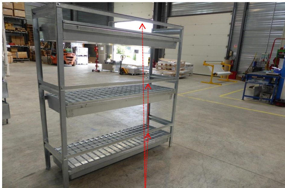
Vue arrière Etagère avec 3 barres de maintien